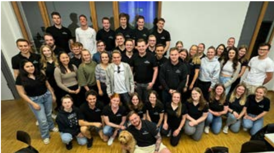
Die Mentor*innen des Instituts für Duale Studiengänge

Auch am Institut für Duale Studiengänge stehen Mentor*innen als Ansprechpartner*innen für dich zur Verfügung. Die Mentor*innen organisieren sich in vielfältigen Komitees, welche verschiedene Aufgaben wahrnehmen. Dazu zählt die Partyplanung, die Gestaltung des Ersti-Wochenendes und Kommunikation über verschiedene Social-Media-Kanäle. Daneben gibt es einen Mentor*innensprecher, welche*r jährlich neu gewählt wird. Dieser übernimmt, zusammen mit drei weiteren Mitgliedern im Mentor*innenrat, die übergeordnete Koordination des Mentorenprogramms und fungiert als Bindeglied zum Institut. Die gesamte Struktur basiert auf dem ehrenamtlichen Engagement der Mentor*innen, die ihre Zeit und Erfahrung freiwillig für die Studierenden einbringen.